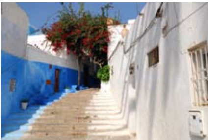
Straßenszene in Blau