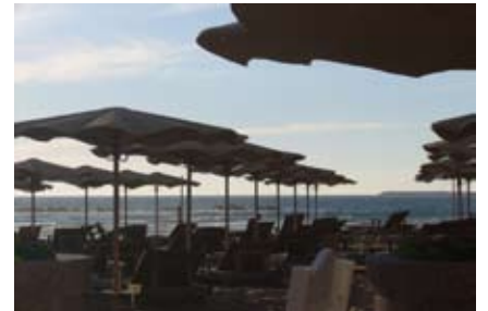
Abendstimmung am Strand