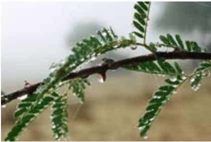
Tau in der Wüste I